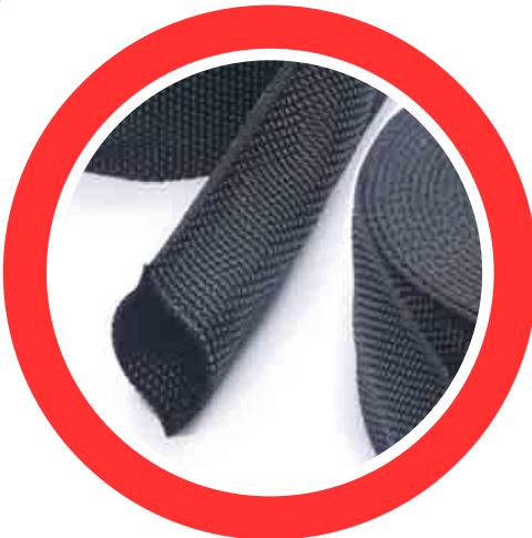
TN FUNDA DE NYLON