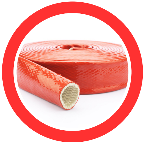
TFVSAT FIBRA DE VIDRIO CON SILICONA ANTIFUEGO