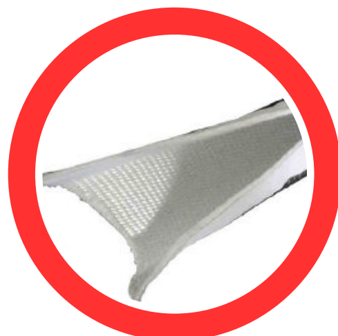
TFVAL-AB FIBRA DE VIDRIO CON ALUMINIO ABIERTA CON VELCRO