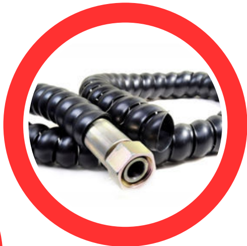
TES TUBO ESPIRAL (ESPIRALINA)