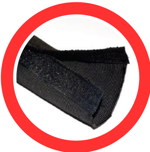
TN-AB FUNDA DE NYLON ABIERTA CON VELCRO