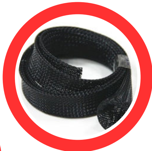
TPEXP FUNDA EXPANDIBLE